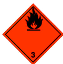
Varningsetikett för klass 3