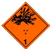
Varningsetikett för klass 1